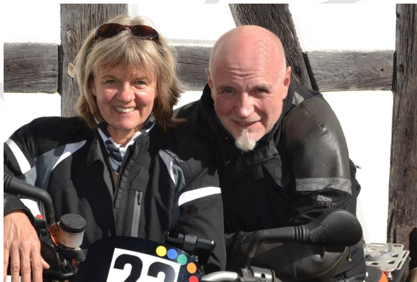
und das Team der Tönenburg